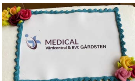
Tårtorna var fint dekorerade.