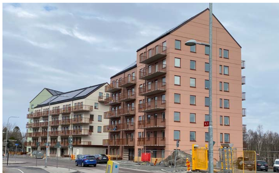
Projektet består av fyra hus. Inflyttningen startade den 1 mars i huset till höger.

Till midsommar kommer alla 129 lägenheterna att vara inflyttade.