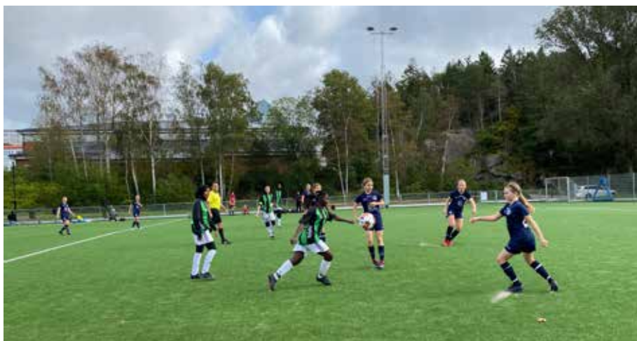
Tjejerna från Gårdsten kämpade hela matchen.