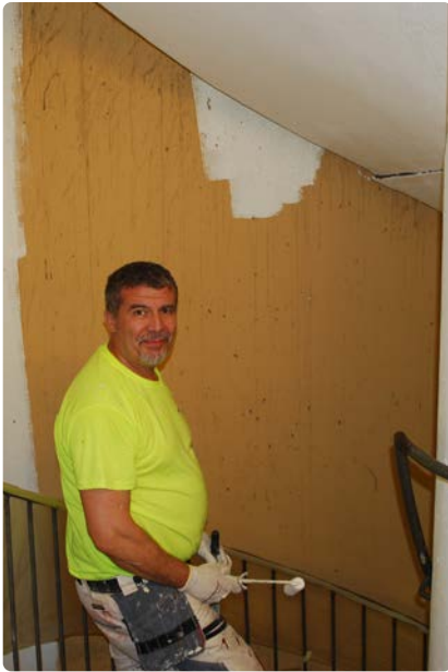
Bolaget renoverar varsamt både trapphus och lägenheter.