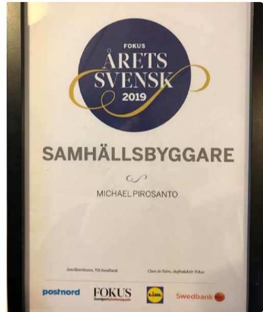
Diplomet för Årets Samhällsbyggare 2019.