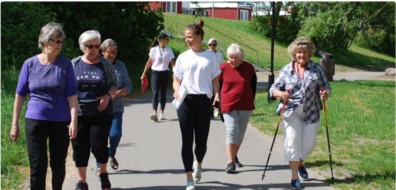
Hälsostugan har arrangerat promenad med styrkepaus för seniorer.