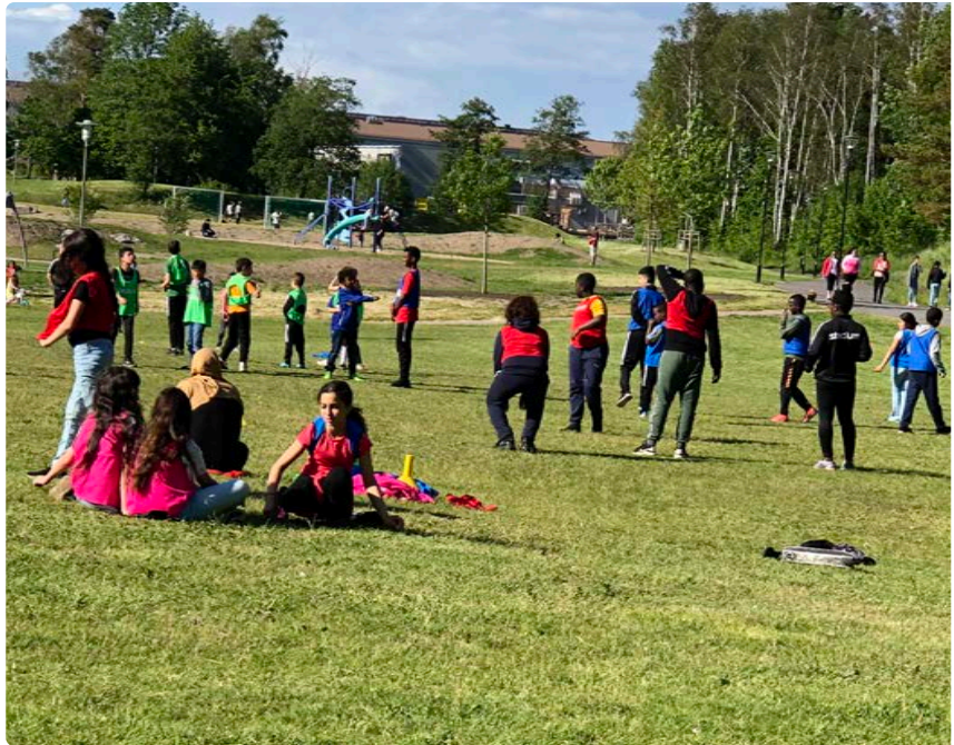
Varje tisdag och torsdag har det varit fotbollsträning. Cirka 100 barn i Gårdsten är medlemmar i Gais.