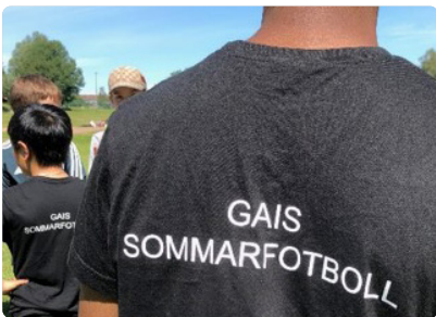
16-22 juni genomfördes sommarfotbollen i samarbete med Gais.