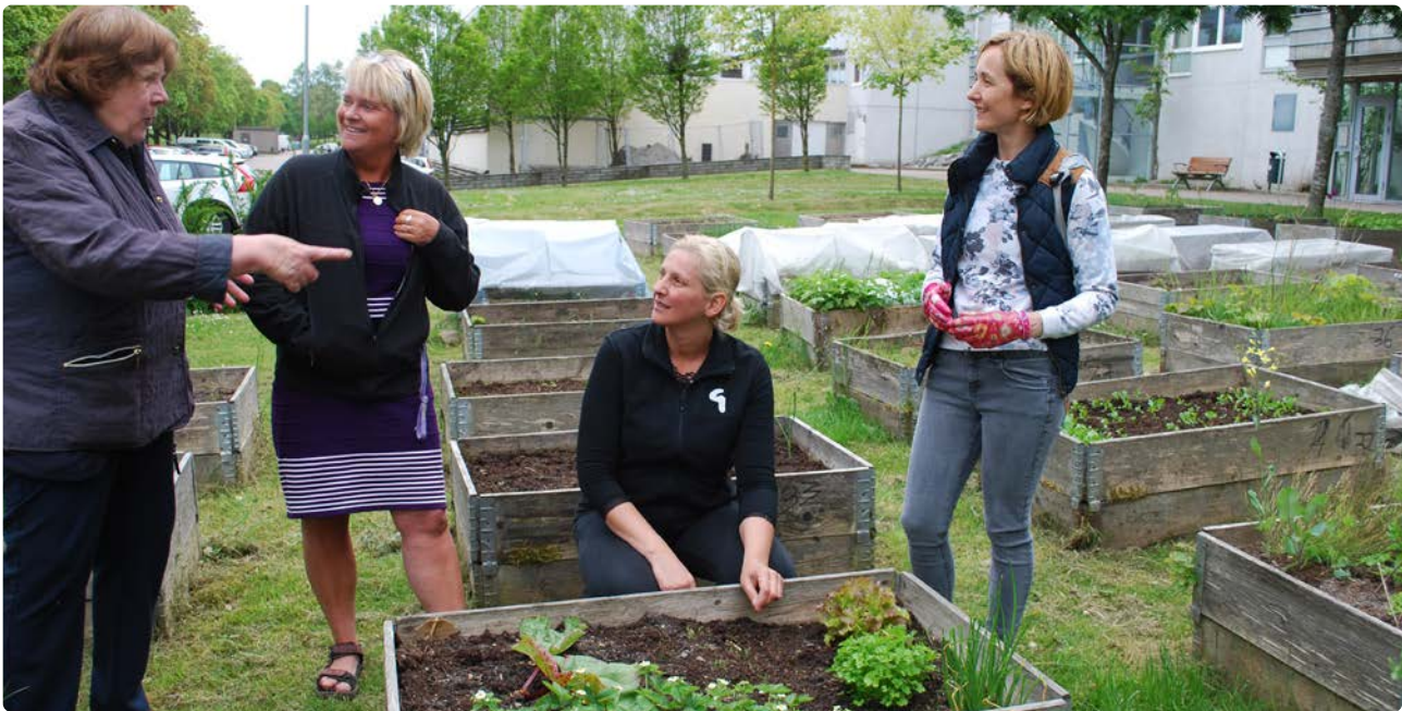
Hyresgästerna har odlingsmöjlighet – antingen i pallkrage eller i växthus. I Gårdsten finns fyra växthus som byggts av Gårdstensbostäder.