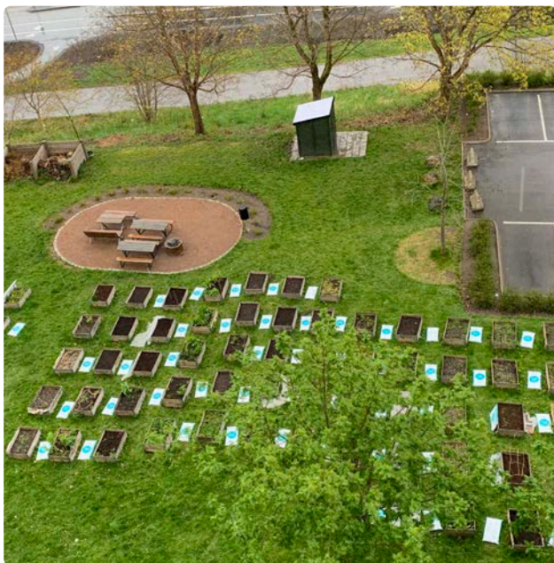
Den stadsnära odlingen har funnits i området i över 20 år. För närvarande finns 497 odlingsplatser.

Alla beslut och beställningar görs av huschefen i respektive område vilket innebär effektivitet i organisationen och korta beslutsvägar.