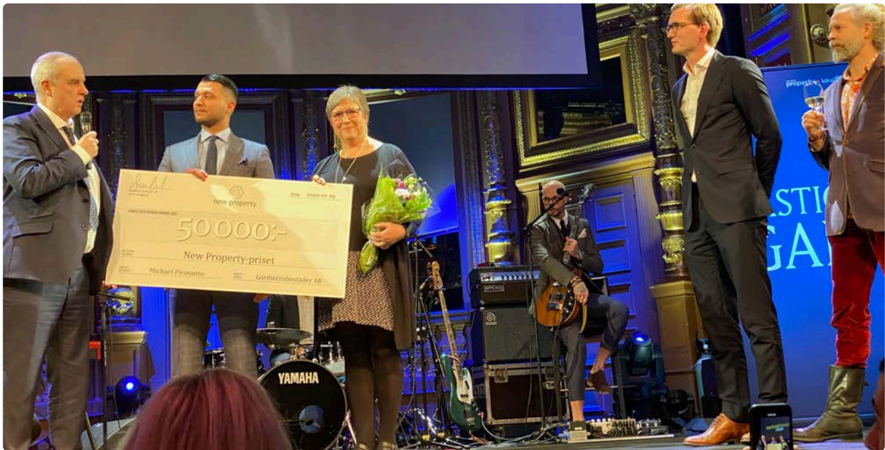
29 januari tog Gårdstensbostäders emot New property-priset på Fastighetsgalan i Stockholm. Prissumman var 50.000 kr.