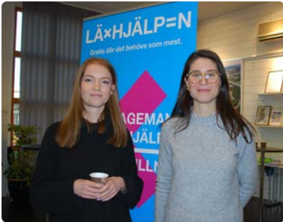
Stiftelsen Läxhjälp erbjuder sedan flera år gratis läxhjälp.