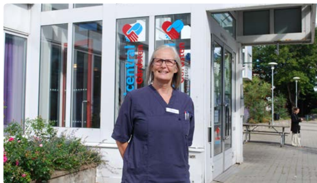
Vårdcentralen har som mål att bli en av Göteborgs bästa vårdcentraler där patienterna ska känna sig trygga.