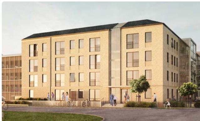
Det nya seniorboendet på Saffransgatan blir inflyttningsklart till november 2021.

En lokal har under året byggts om till fyra lägenheter. Uthyrningen sker första kvartalet 2021 via Boplats.