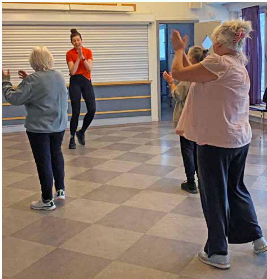
Dags att släppa loss med dansgympa i Seniorlokalen på Muskotgatan 10.

Därefter torsdagar, jämna veckor till den 15 maj. 📍