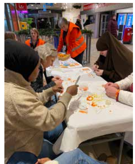
Det knöts många armband i Gårdsten Centrum.