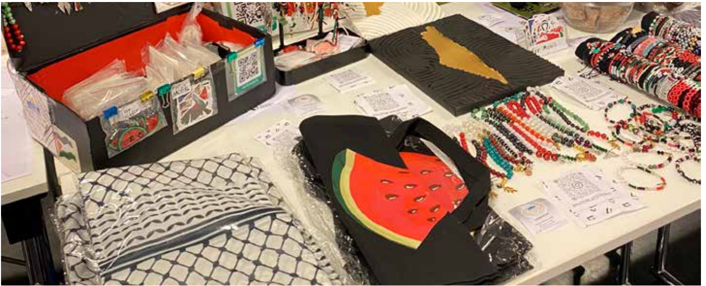
Unga entreprenörer och företag deltog på eventet i Idéum.