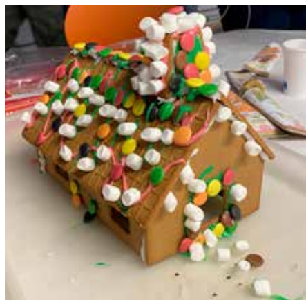
Många vackra hus blev det på Peppargatan.

Det var pyntat och fint i växthuset. Den 30 november ställde nämligen ett tiotal hyresgäster upp och monterade ljusslingor både på husens loftgångar samt i områdets två växthus. 🔄