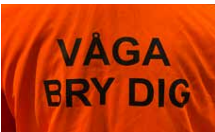
Hela veckan gick i orange hos Gårdstensbostäder.

Besökare hade möjlighet att prata om hur man kan våga bry sig i kampen mot våld. Dessutom var det många som knöt armband i orange färg och pärlade. 🌈