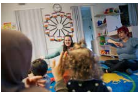
Sångstund på öppna förskolan Gårdsten