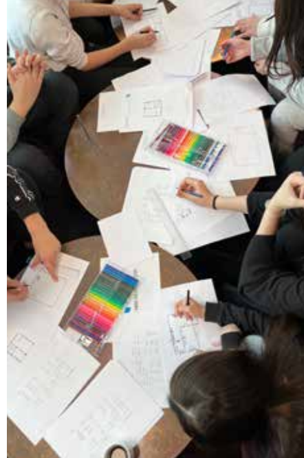
Under FutureDay den 4/3 fick eleverna bl a rita sin drömbostad.

Även AstraZeneca ser Skollyftet som en möjlighet att inspirera och stötta unga,