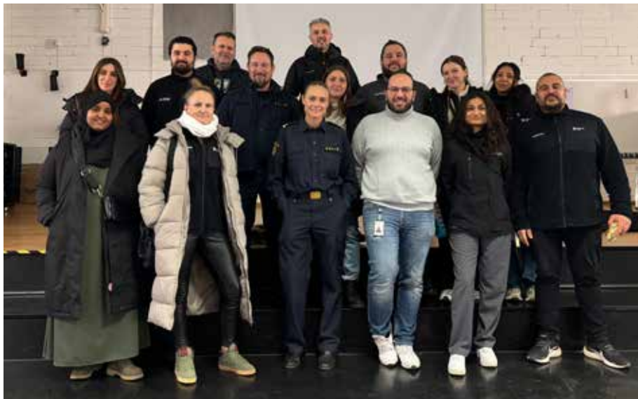
Med på bild finns representanter från Gårdstensbostäder, Polisen och Socialtjänsten Nordost.

Då har du möjlighet att diskutera mer kring trygghet med utställarna. Välkomna!