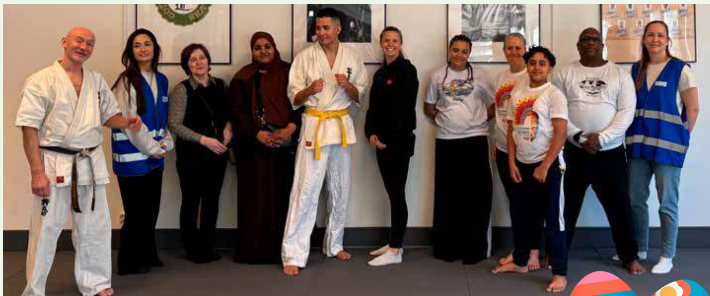
Arrangörerna av prova-på-träning i Gårdstens Kampsportcenter den 9 april.