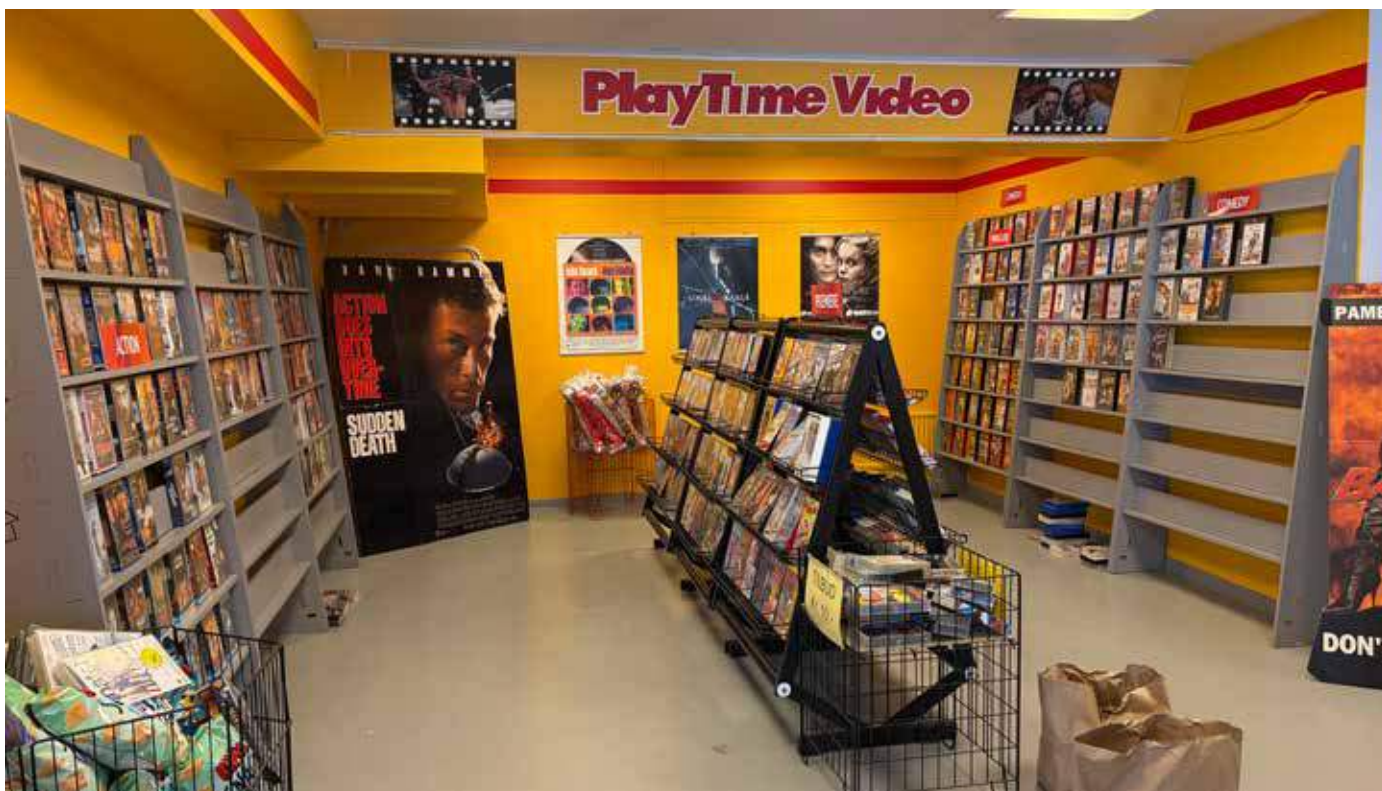
Inne i lokalerna byggdes det upp en videobutik.