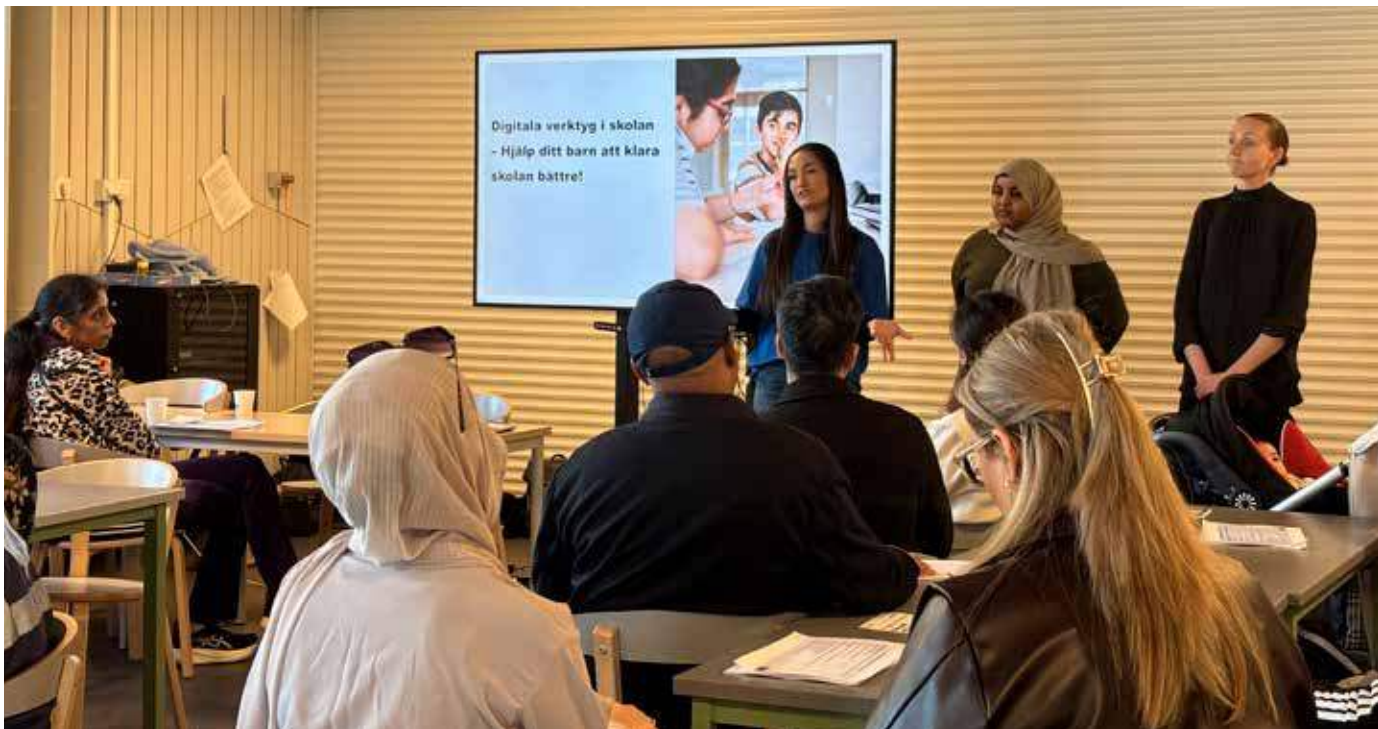
Bild på deltagarna under månadens Föräldrarforum på Lilla Gårdstensskolan.