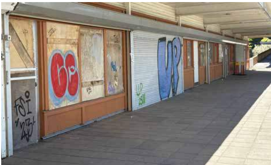
Graffitin på väggarna kan lätt spolas av och återställas efter filminspelningen.

Graffitin som målades på väggarna var vattenbaserad färg och kan lätt spolas av och återställas igen. Långfilmen beräknas ha premiär våren 2027. 🌱