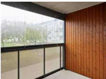
Exempelbild på balkongen.

Gårdstensbostäder ha etablerat en egen modell för seniorboende. Det första boendet öppnades redan 2004 och blev mycket uppskattat. Modellen är unik genom att den inte drar några kostnader som belastar samhället för övrigt. Totalt finns här redan ca 150 seniorlägenheter