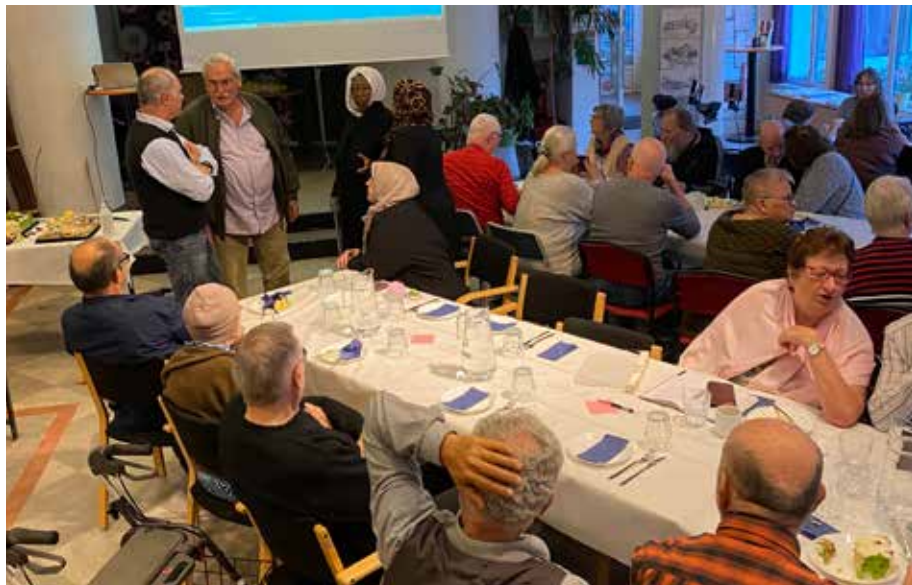
Att kunna träffas igen på Muskotgatan 10 var uppskattat bland seniorerna