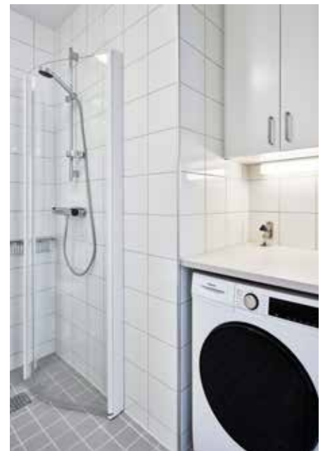
I badrummen finns kombimaskin i alla lägenheter för tvätt.