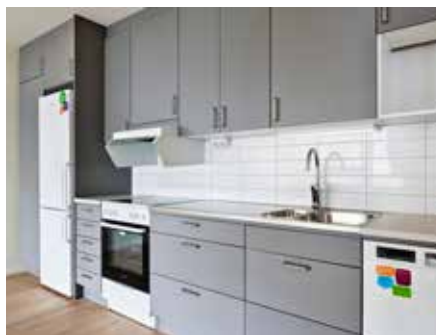
Exempelbild på kök.