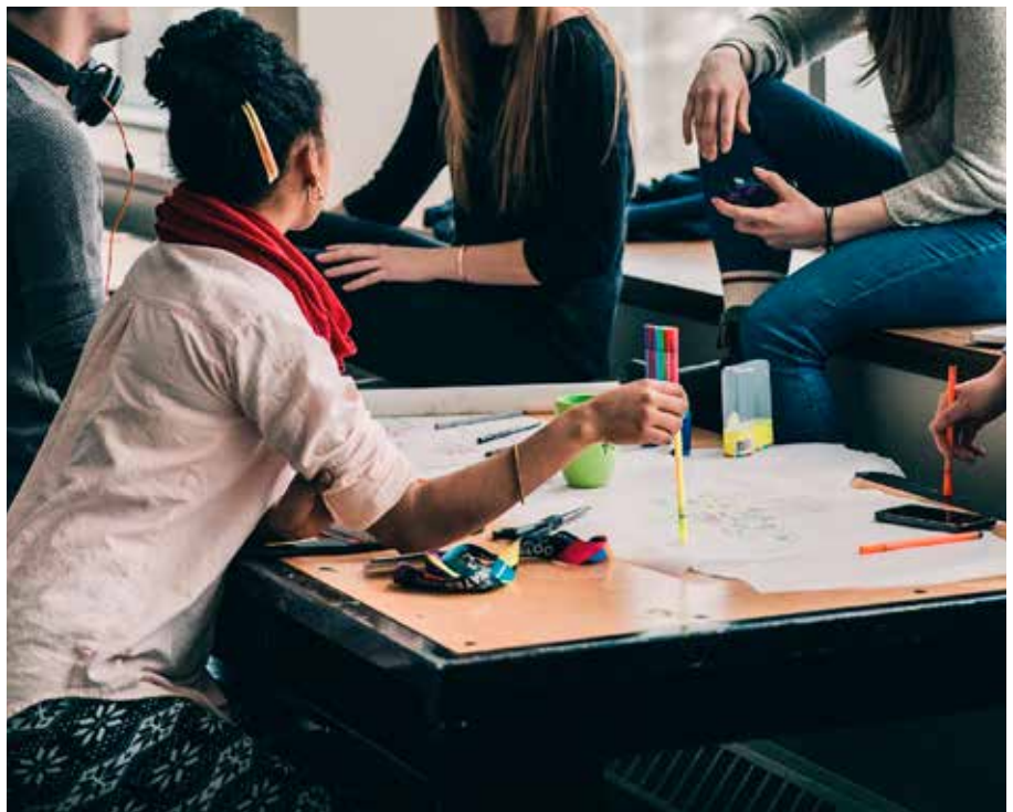
Fastighetsmarknaden ligger öppen för de studenter som utbildar sig på Fastighetsakademin.