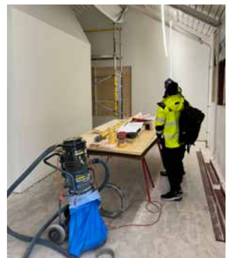
Byggnation av sushin

Byggnationen av Sushi-baren är i full gång inne i Gårdsten Centrum. Öppnas preliminärt månadsskiftet maj/juni.