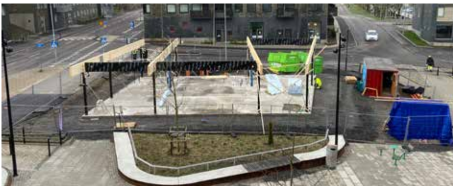
Nu har plattan gjutits och stommen har börjat resas.

Under montaget och lyften kommer det vara höga ljud då kranen tjuiter samt att maskinerna ger ifrån sig ett ljud likt ett skott när stommen monteras.