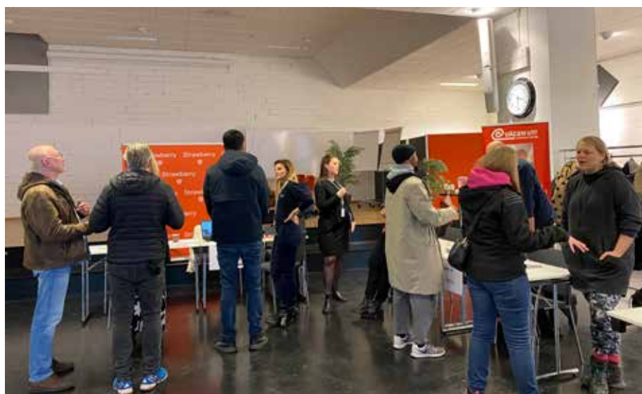
Jobbmässan ägde rum på Idéum.