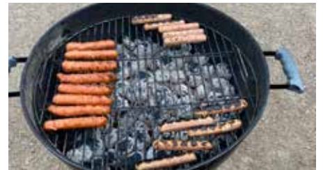
Korvgrillning efter städningen.