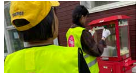
Snart dags för popcorn.