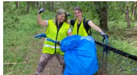
I skogen hittades också en massa skräp.

Budskapet som Dalens Vänner har på sina västar är något som angår alla – Tänk på var du slänger ditt skräp. ♻️