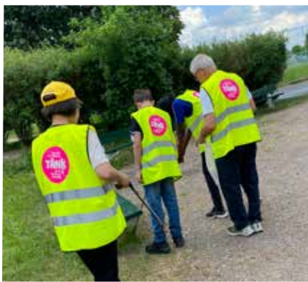
Barn och personal från Fritidsklubben Diamanten deltog.

Massor av bland annat plast, kartonger, fimpar samt till och med en säng plockades bort från grönområdena och gator.