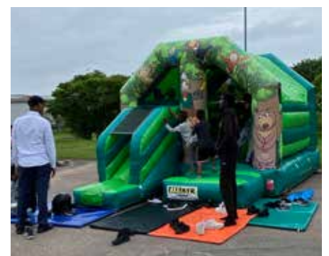
En hoppborg fanns på plats.