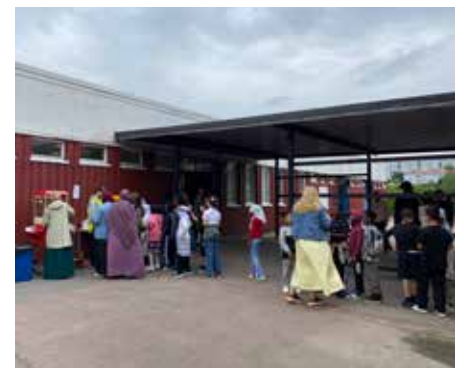
Kön var lång till popcornmaskinen.