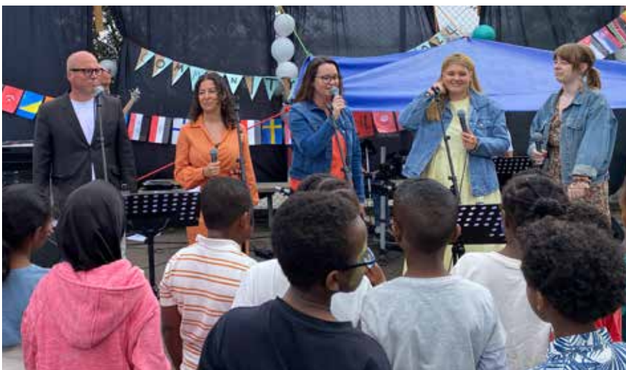
Räddningsmissionens orkester och artister uppträdde på Communitydagen.