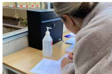
Det fanns formulär med frågor där de boende kunde ge synpunkter på sitt boende.