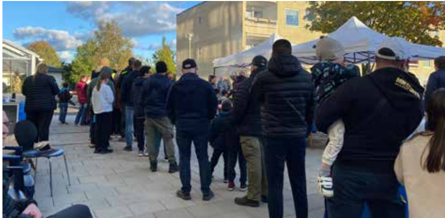
Det blev kö till grillningen men alla hyresgäster fick sina hamburgare.