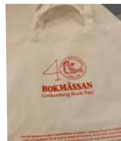
Bokmässan är en av Fabrikörernas kunder sedan flera år.

Den 7 november kl 13 håller Fabrikörerna invigning i de nya lokalerna. Alla är välkomna! Anmälan behövs, maila till info@fabrikorerna.com.