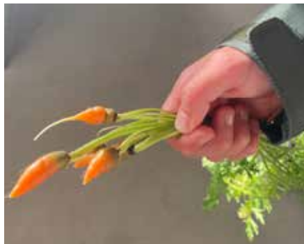
Små morötter är också goda.