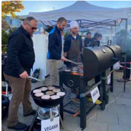
Grillmästare på rad.