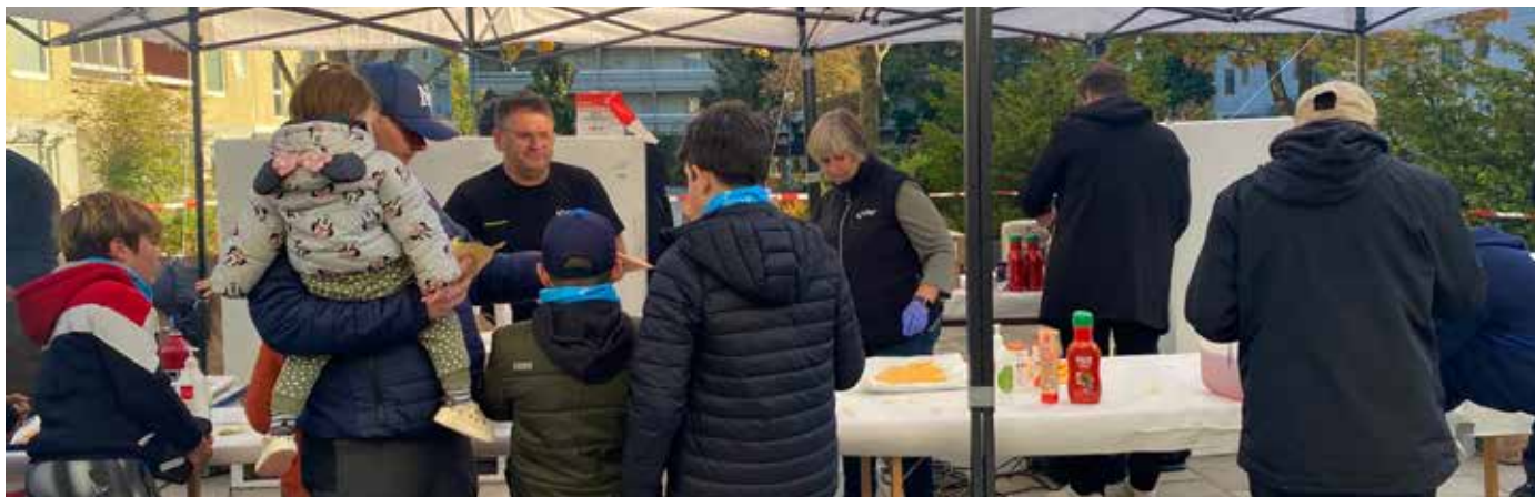
Här pågår serveringen för fullt.