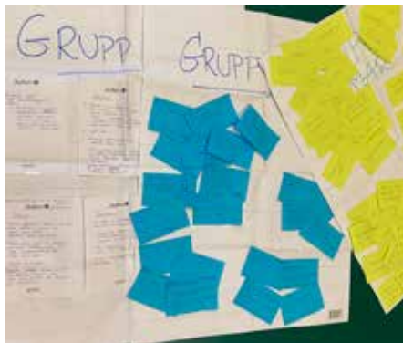
Resultatet från styrelsens workshop.