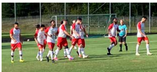
Gårdsten FC har precis tagit ledningen med 1-0 mot Annedal FF.