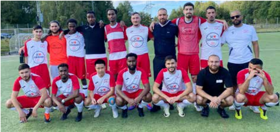
Gårdsten FC spelar i division 7 Göteborg B herr. Majoriteten av spelarna är från Gårdsten.