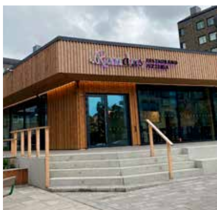
Randas Restaurang & Pizzeria ligger på Salviatorget i Gårdsten Centrum

Etableringen av Randas innebär ett antal nya arbetstillfällen i Gårdsten.