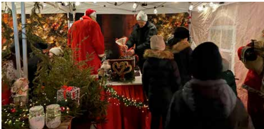
Det var mysigt på Salviatorget när tomten kom på besök och det serverades glögg och pepparkakor.