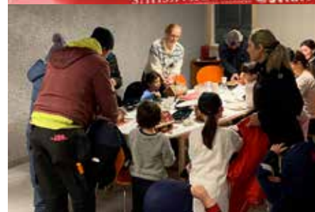
Bilder på en del av alla dom fina pepparkakshus som byggdes och dekorades under kvällen.