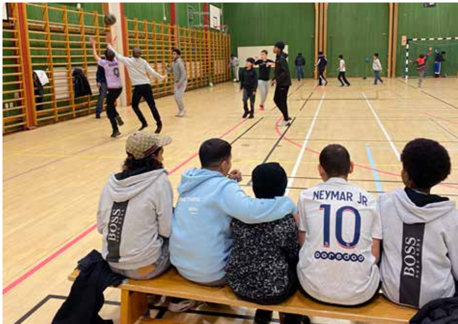
Det är full fart i hallen på lördagskvällar.

Tid: kl 18-20 för barn som är under 15 år Kl. 20-22 för ungdomar över 15 år. 📍