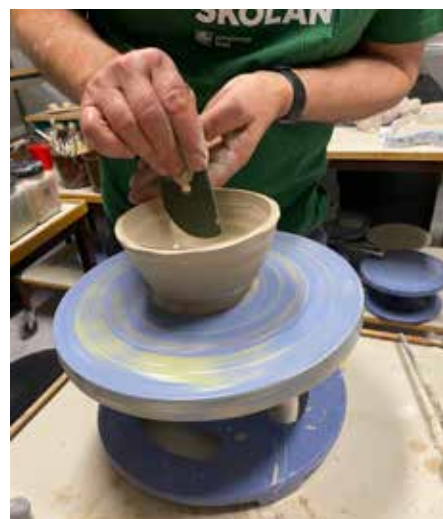
Så småningom kanske eleverna kan forma så här fina skålar.

På Lilla Gårdstensskolan har det startats dramalek för de yngre och teater för de