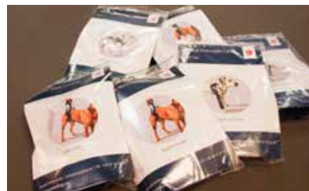
Ortopediska hjälpmedel för hundar som till exempel används efter att hunden genomgått en operation.

som används vid olika event. Efter användning tar Tråd & Trade hand om veporna för att sy väskor, necessärer och annat som sedan säljs i museets butik. Alternativet hade varit att bränna veporna. Detta har uppmärksammats av olika företag som också använder reklamvepor. Företagen har börjat ta kontakt med Tråd & Trade redan innan de aktuella evenen och beställt återanvändning av veporna.