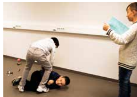
Inspelning av filmen "Mobba inte nördar för dom kan göra världen bättre".