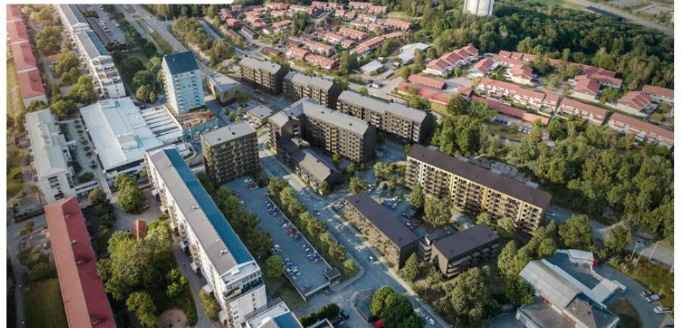
Området efter färdigställande